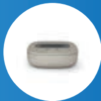
ComPilot II mit TVLink II oder ComPilot Air mit TVLink II